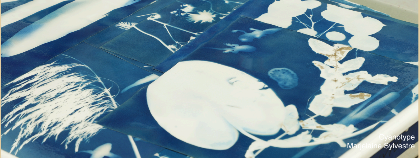
Cyanotype Marjelaïne Sylvestre